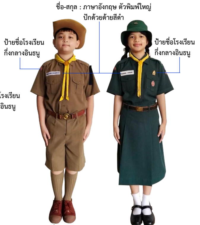
เครื่องแบบ ลูกเสือ/เนตรนารี สามัญ ระดับชั้นประถมศึกษาปีที่ ๔-๖ EP/IEP