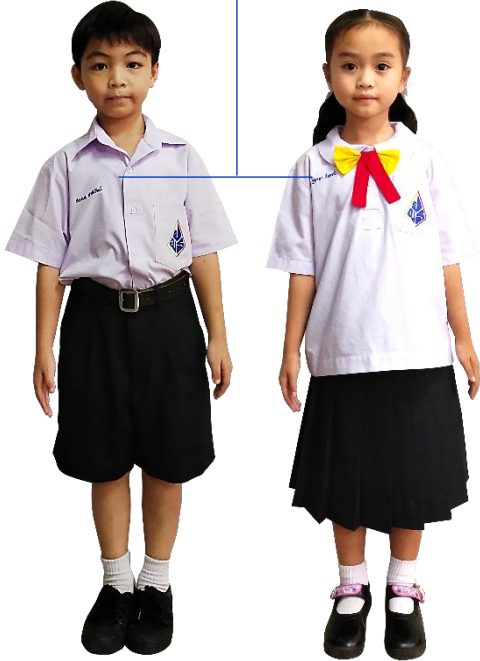
ชุดนักเรียน SP

ชื่อ-สกุล : ภาษาไทย ปักด้วยด้ายสีน้ำเงินเข้ม