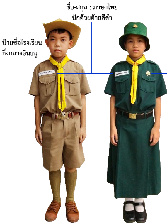
เครื่องแบบ ลูกเสือ/เนตรนารี สามัญ ระดับชั้นประถมศึกษาปีที่ ๔-๖ SP