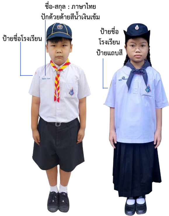
เครื่องแบบ ลูกเสือ/ยุวกาชาด ระดับชั้นประถมศึกษาปีที่ ๑-๓

นักเรียนของโรงเรียนประถมศึกษาธรรมศาสตร์ทุกคน ต้องแต่งกายให้ถูกต้องตามระเบียบของโรงเรียน